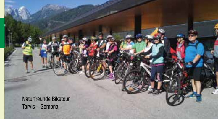
Naturfreunde Biketour Tarvis – Gemona