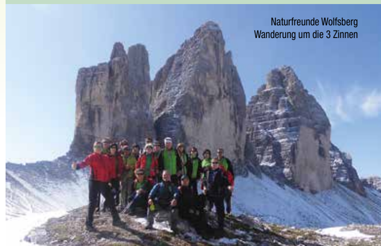
Naturfreunde Wolfsberg Wanderung um die 3 Zinnen

25. Februar Kärntner Woche – Schitag Klippitztl. Treffpunkt: 9.00 Uhr beim Info Zelt an der Liftkassa. Mit Woche Gutschein 50 % auf die Tageskarte!