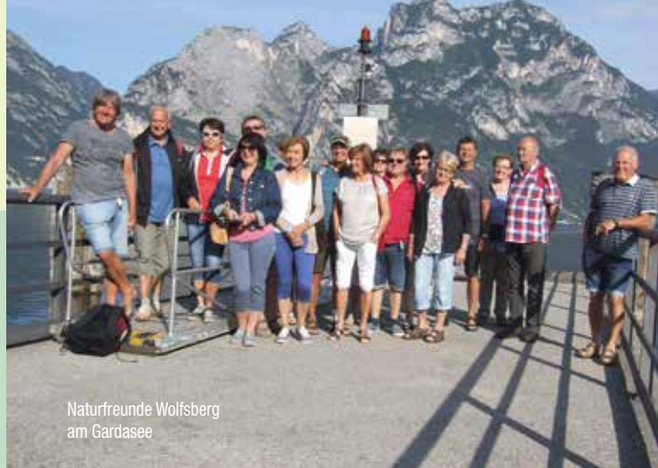
Naturfreunde Wolfsberg am Gardasee