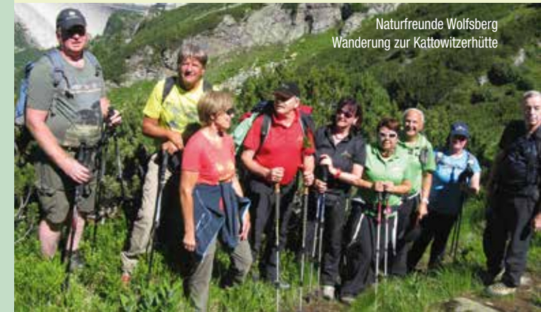
Naturfreunde Wolfsberg Wanderung zur Kattowitzhütte

6.–7. Juli Hoher Sonnblick 3106m Hochtour vom Mölltaler Gletscher Abfahrt: 6.00 Uhr vom Hervis Parkplatz