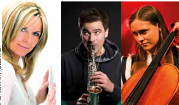
© Sonja Kleindienst | Edgar Unterkirchner

Donnerstag, 3. August 2023 | 19:30 Uhr | Eintritt € 28,00 Kapuziner Garten | Alois Huth Straße 6 | 9400 Wolfsberg (bei Schlechtwetter in der Kirche)